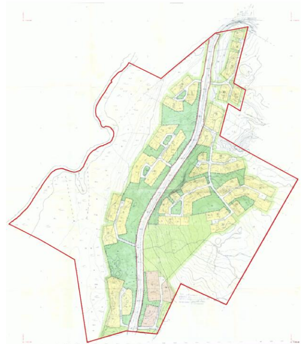
Kuva 3. Ote voimassa olevasta asemakaavasta.

Asemakaavassa alueelle on osoitettu Asuinpientalojen ja majoitusrakennusten kortteli-alue, lähivirkistysalue, erillisloma-asuntojen kortteli-alue, rivitalojen ja muiden kytkettyjen loma-asuntojen kortteli-alue, Matkailua palvelevien rakennusten kortteli-alue, Maa- ja metsätalousalue, jossa maanpinnan muokkaus ja avohakkuu on kielletty, sekä maa- ja metsätalousalue, jonka käytössä tulee huomioida ulkoilun tarpeet sekä ympäristönhoidon vaatimukset.